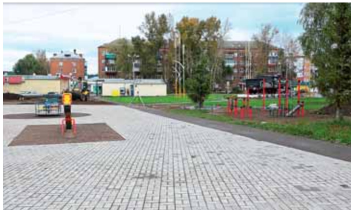
Обустройство спортивной площадки в Сарапуле

76 млн рублей. Доля средств от населения и спонсоров в районах в среднем составила 10% от общей стоимости проектов, в городах – 8%. Как отмечают в Минфине Удмуртии, это достаточно высокие показатели на уровне страны.