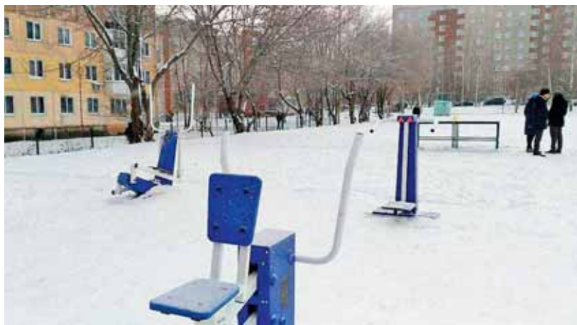
Спортивный парк «Союзники» на территории школы № 81

сальная площадка с мягким безопасным покрытием для командных спортивных игр, занятий на уличных тренажёрах, проведения соревнований. Спортпарк стал точкой притяжения для жителей района разных возрастов.