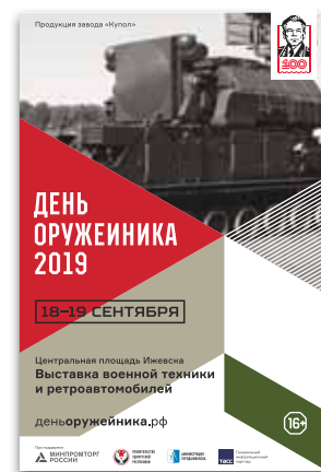
Пример оформления афиши