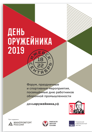
Пример оформления афиши

Удмуртия вышла на финишную прямую в подготовке празднования юбилея одного из самых известных своих земляков. 10 ноября 2019 года Михаилу Тимофеевичу Калашникову исполнилось бы 100 лет. На встрече 14 января приглашение принять участие в праздничных мероприятиях получил и президент РФ Владимир Путин. О том, какой предполагается программа, как будет смотреться праздник на фоне юбилеев других выдающихся россиян и чем он может стать для республики – в нашем материале.