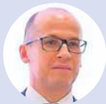
Александр БРЕЧАЛОВ, глава Удмуртии: – Главное событие форума в Сочи – присвоение Глазову

статуса территории опережающего социально-экономического развития. По заявкам на локализацию новых предприятий здесь предусмотрено вложение более 16 млрд руб. и создание более 2500 рабочих мест. Темпы развития первой территории опережающего развития – Сарапула – мы выдерживаем. Но сразу хочу