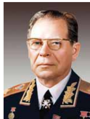
Дмитрий Фёдорович УСТИНОВ,