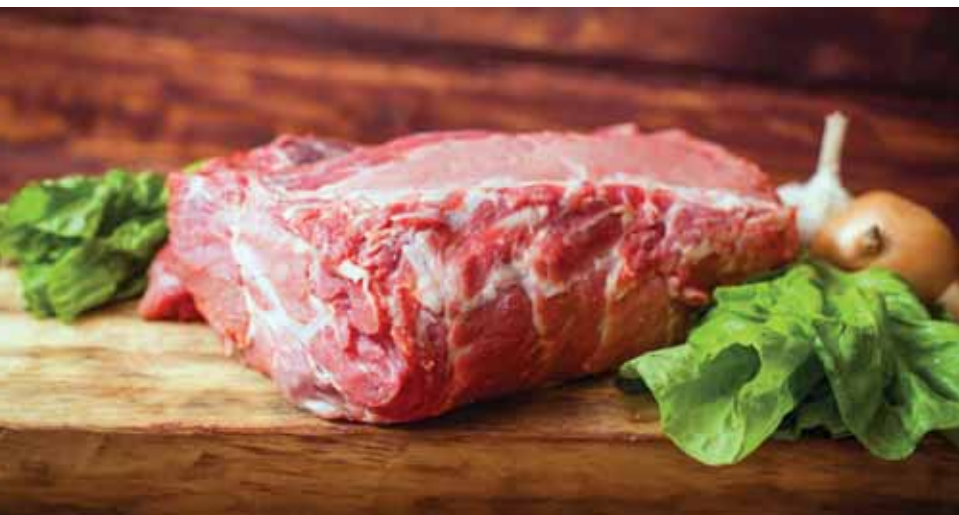
Шейная часть свинины – самое лучшее мясо для шашлыка

Мясо баранины по своей структуре более жёсткое. Для того, чтобы размягчить его волокна, можно в качестве маринада использовать сок граната или киви. При этом мариновать в киви дольше 15 минут шашлык не следует, иначе готовый продукт будет горчить.