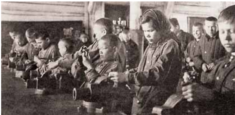
Война. Дети, Ижевский мотозавод