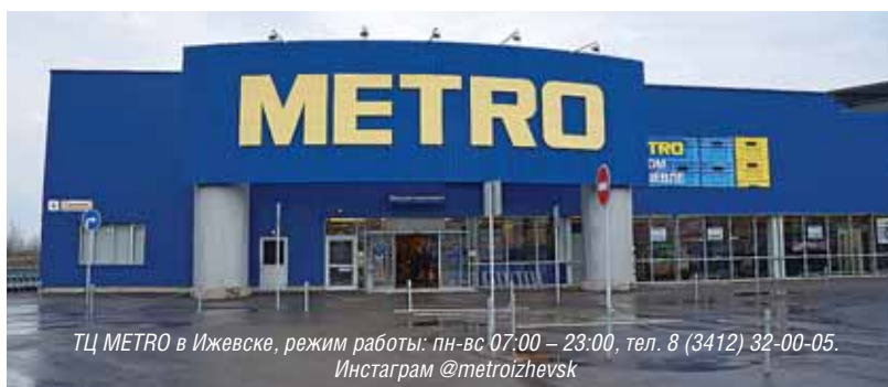
ТЦ METRO в Ижевске, режим работы: пн-вс 07:00 – 23:00, тел. 8 (3412) 32-00-05. Инстаграм @metroizhevsk

Теперь и всегда на полках METRO будут находиться новые ценники с тремя уровнями цен. Третий уровень цены – для оптовых закупок, второй – для мелкооптовых клиентов. Это предложение востребовано и эффективно для различных категорий клиентов: владельцев ресторанов, кафе, магазинов у дома. А также для ситуаций, когда опт актуален для персональных нужд. Кроме появления новых ценников, ожидаются изменения в торговых залах. Изменится выкладка в основных коридорах: специальные акции и промо-активности останутся доступными клиентам, но основной фокус будет сделан на возможность закупаться дешевле за счёт объёма. Цены