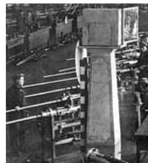
Авиационный пулемёт Нудельмана на «Ижмаше»

Известно, что во время Великой Отечественной войны Ижевск стал главной кузницей стрелкового оружия нашей страны. Всего за 1941–1945 гг. ижевцы отправили на фронт столько оружия, сколько его было изготовлено за все предшествующие 70 лет! Каждые сутки только машиностроительный завод вооружал одну стрелковую и одну авиационную дивизии. Всего Рабоче-крестьянская Красная армия получила от Ижевских заводов 11 145 тыс. винтовок и карабинов, 7 130 авиапушек, 213 440 пулемётов системы Березина и «максим», 131 310 противотанковых ружей системы Дегтярёва (ПТРД) и Симонова (ПТРС), 961 500 пистолетов системы Токарева (ТТ) и других видов оружия. ●