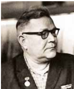
Е. Ф. Драгунов, конструктор стрелкового оружия