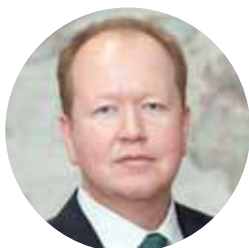
Алексей ЗАГРЕБИН, депутат Госдумы РФ:

– Удивительно, но факт: в нашей стране эта традиция исконно кавказского происхождения распространилась практически повсеместно. Порядка 20 лет назад я работал преподавателем на Ямале, где тогда находились филиалы УдГУ. Я читал курс политологии, истории России, государства и права и приехал в Старый Уренгой,