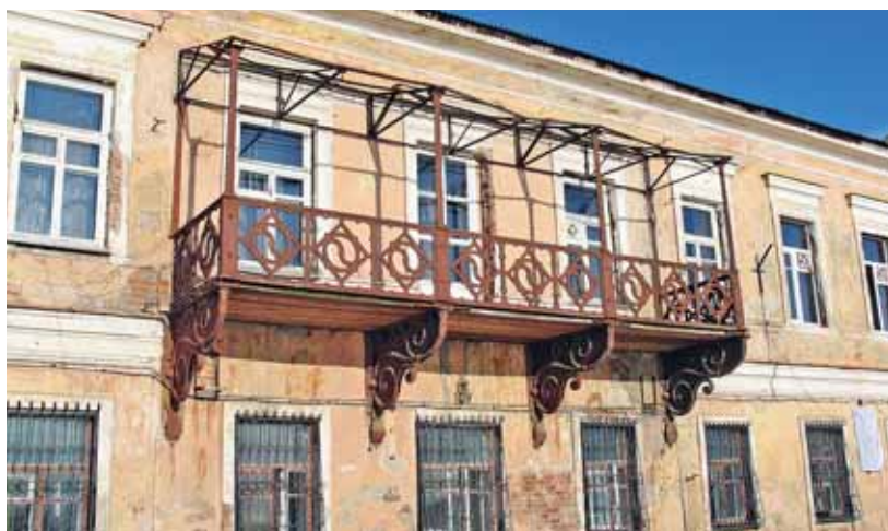
Здание ижевского ЧК, генеральский дом

местные нужды, а потом уже в уездный распорядительный фонд».